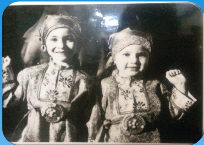
Первый выпуск «Ватана»