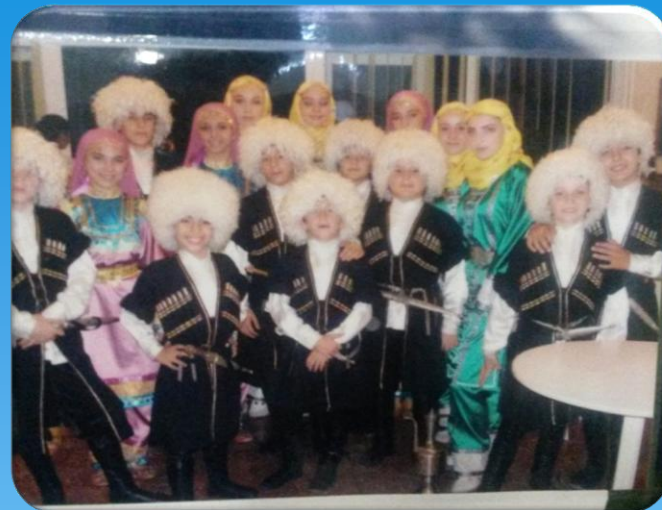
Президент комплекс концерт